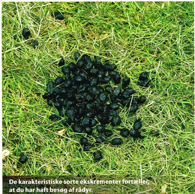
De karakteristiske sorte ekskrementer fortæller, at du har haft besøg af rådyr.