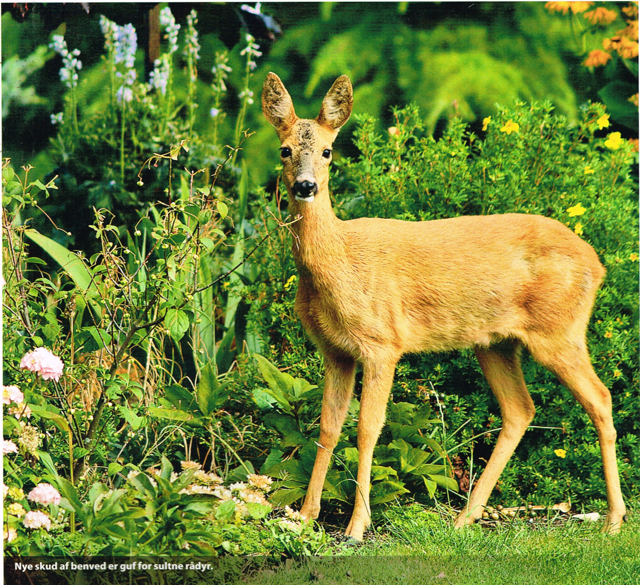
Nye skud af benved er guf for sultne rådyr.