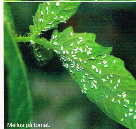
Mellus på tomat.