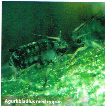
Agurkbladlus med rygrør.