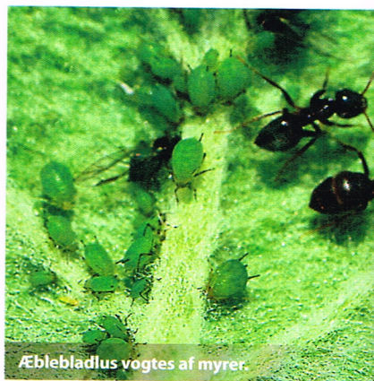
Æblebladlus vogtes af myrer.